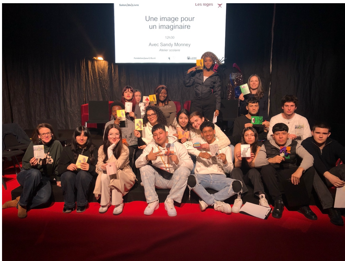
Atelier de médiation culturelle littéraire Une image pour un imaginaire au salon du livre de Genève avec deux classes d'ACCESII - Rousseau dans le cadre du projet : Journal de bord autour de L'analphabète d'Agota Kristof, 2025