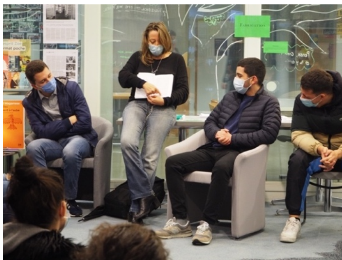
Médiation lors de l'exposition « La Vie d'un livre » à la bibliothèque du collège A. Chavanne

Sandy.monney@editionszoe.ch // 022 309 36 06