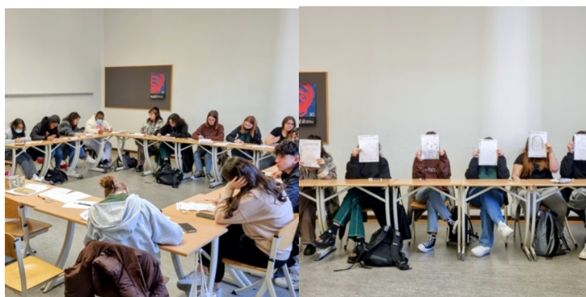
Atelier d'écriture au Collège Ella Maillart